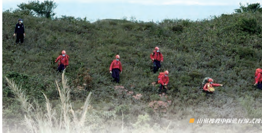
山嶺搜救中隊進行架式搜索

部隊於2023年2月9日參與跨部門山火及攀山拯救行動演習。參與演習的部門及服務機構包括消防處、香港警務處、政府飛行服務隊、漁農自然護理署、醫療輔助隊、民眾安全服務隊、民政事務總署、社會福利署和醫院管理局。本港去年有超過600宗山火及逾千宗攀山拯救事故，當中有20人死亡，創過去5年新高。是次演習定於大嶼山彌勒山，模擬多人被山火包圍及受傷，歷時約兩小時。