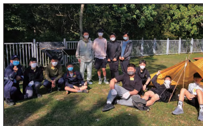
■ 學生在首日搭建簡單營地，並以此為三天的「小組基地」

是次活動共超過130名中三學生參加。因應人數眾多，「民盡其才」計劃導師在活動前兩個月已開始著手進行籌備工作，包括與校方商討訓練目的及內容，與教練團隊召開工作會議，視察場地，準備物資，並在活動前一星期進行任務述要等工作，務求活動可以順利完成，令學生有所得著。