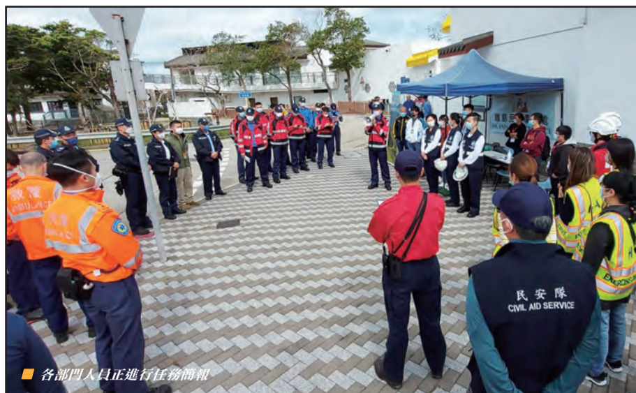
各部門人員正進行任務簡報

2023年2月12日(星期日)，渣打馬拉松賽事順利舉行，民安隊在港九兩岸共派駐80名長官、隊員，負責人群管理工作。隊員由凌晨4時開始當值，分別在尖沙咀彌敦道起點、維多利亞公園及天后港鐵站出口，協助人群管理工作。