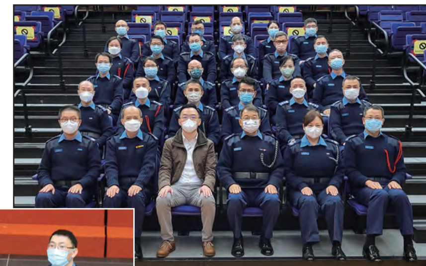
■ 與保安局政府保安事務主任朱文龍先生合照

此外，課程有幸邀請了保安局政府保安事務主任朱文龍先生蒞臨，分享施政報告《保安篇》的內容。參與的長官們聽取了朱先生的詳盡解說，加深了對政策局推行各項工作的認識，在日後在行動策劃上增加了信心。