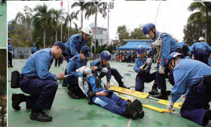
隊員示範搶救傷者

2023年3月26日，部隊舉行第85屆新隊員結業會操，並由保安局常任秘書長李百全JP擔任檢閱官。