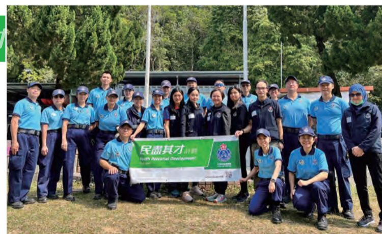
■ 「民盡其才」計劃導師

2023年2月20日至22日，社區教育組聯同「民盡其才」計劃導師前往民安隊大灘訓練營，為英華書院的中三級學生舉辦了一連三天的領袖訓練活動。是次活動旨在提升這些學生的抗逆能力，以協助他們應付即將在高中面對的挑戰。與此同時，持續三年的疫情影響了學生的社交生活，他們缺乏面對面相處及溝通的機會。因此，社區教育組希望透過這次訓練加強他們的團體精神，提升凝聚力及增進感情。