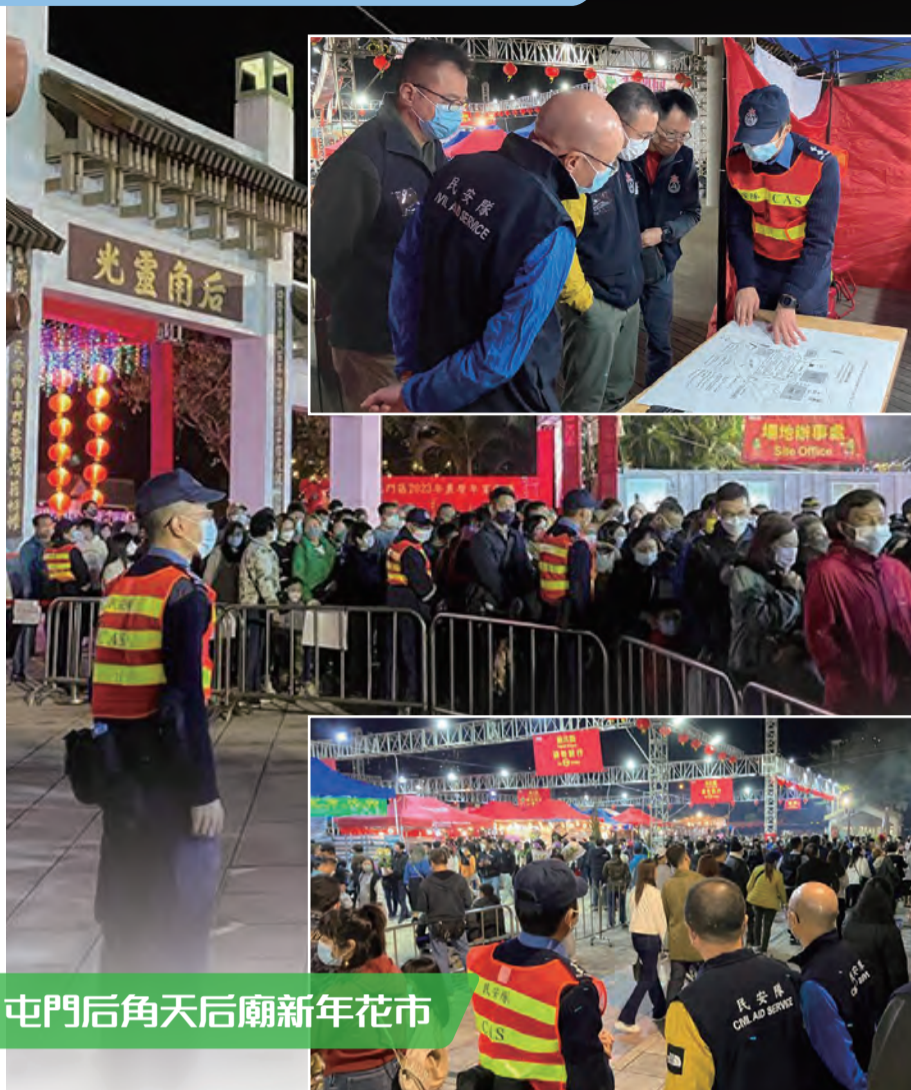
屯門后角天后廟新年花市