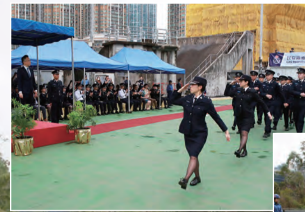
會操隊伍操越檢閱台