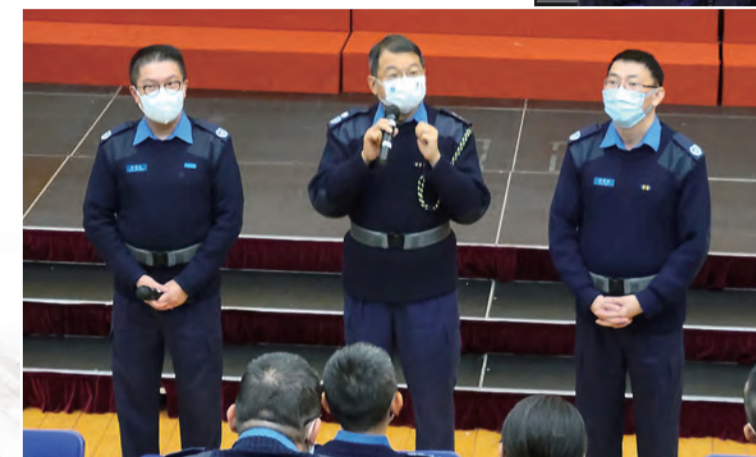
■ 高級長官們就課程內不同議題各抒己見，坦率交流