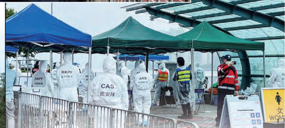
民安隊員在馬料水碼頭執行人群管理任務