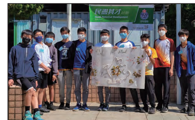
■ 學生在最後一天活用營地內的天然材料設計海報，總結美好的三天之旅

在籌備過程中，「民盡其才」計劃導師相互交流，毫不吝嗇分享自己在部隊所學到的才能及技術；大家踴躍發表意見，商討訓練內容，務求令活動更臻完美。這正是「民盡其才」計劃的其中一個目的：來自不同中隊的導師展示才能及互相學習，並在活動中積極投入參與，用自身的經驗與學生分享。相信一眾導師見到同學在短短三日已有很大的改變，一定深感付出的努力變得有意義非凡。