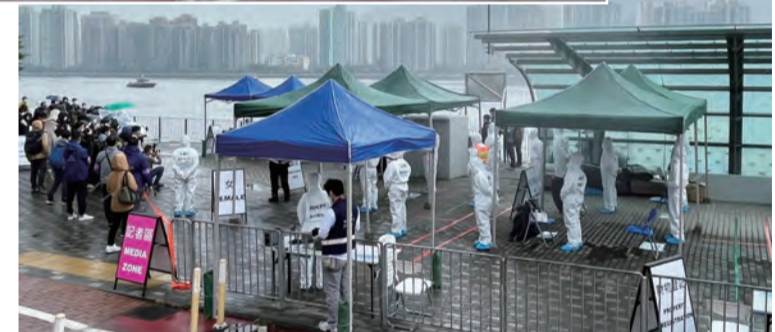
民安隊隊員在文錦渡管制站扮演跨境旅客，接受洗消