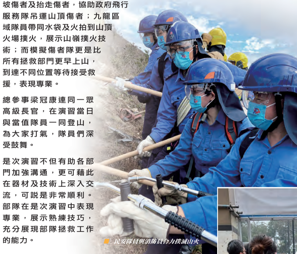
民安隊員與消防員合力撲滅山火

是次演習不但有助各部門加強溝通，更可藉此在器材及技術上深入交流，可說是非常順利。部隊在是次演習中表現專業，展示熟練技巧，充分展現部隊拯救工作的能力。