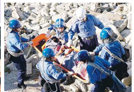
▲九十年代開始，一般隊員的頭盔採用彩藍色。