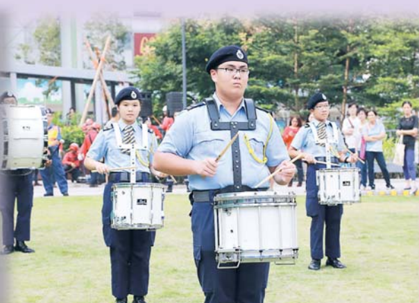
▲少年團小鼓隊經常公開演出，表演屢獲好評。