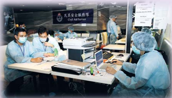
▲大型疫症爆發，協助管理檢疫隔離中心亦是民安隊緊急任務之一。

運輸中隊人員主要負責駕駛民安隊車輛，他們每逢假日均會派員駕駛電單車，巡邏指定郊野公園內的熱門郊遊範圍，以便隨時協助有需要的郊遊人士。此外，假若鄰近香港的核電廠發生輻射洩漏事故，電單車駕駛員亦負責到指定地點收集空氣樣本，供天文台化驗和分析之用。