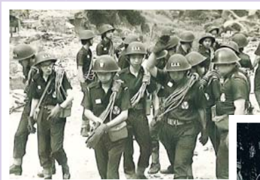
▲七十年代，民安隊隊員執勤時使用的頭盔以金屬製造，並配上糧袋、水壺和藥袋等個人裝備。

制服方面，民安隊成立初期，隊員制服為深藍色，款式與英國民防部隊相當接近。至七十年代後期，制服款式有所轉變，隊員及長官的一號夏季制服改為翻裝；冬季制服改為開胸款式，配以白恤衫及黑領帶，長官制服左右衣袖口各有三顆鈕扣，外衣領別上金屬隊徽。到了2000年，民安隊的一號制服改為長袖，再無冬季之分；行動制服方面，物料由深藍色十字布改為彩色厚棉布，款式亦由短袖改為長袖，加強在行動時對隊員的保護。