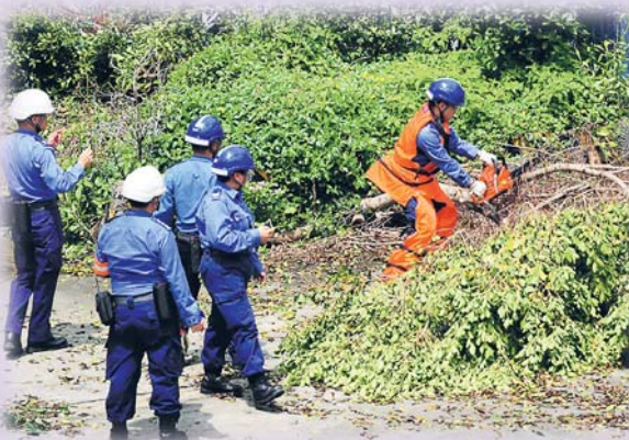
▲區域中隊人員正在鋸掉因颶風吹襲倒塌的樹木

除了緊急任務外，民安隊的非緊急任務涵蓋範圍亦非常廣泛，而人羣管理是主要任務之一。每逢有大型文化節慶或體育活動及比賽舉行，民安隊都會派出隊員協助警方及主辦機構管理和疏導人潮，維持秩序，令活動得以順利進行。