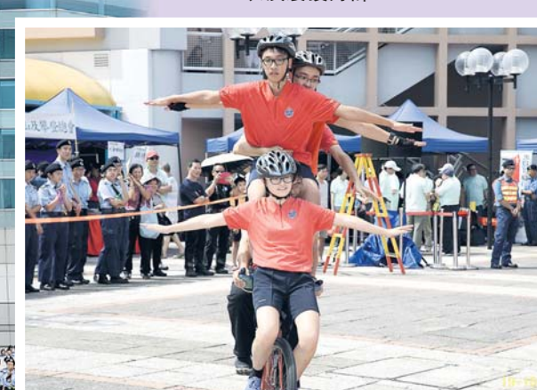
▲少年團花式單車隊表演同樣出色