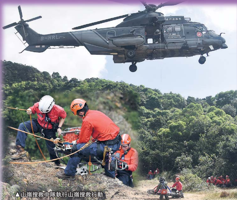
▲山嶺搜救中隊執行山嶺搜救行動

民安隊是提供多元化服務的輔助應急隊伍，成立65年來，一直以服務社會為己任。除了在發生天災或緊急事故時執勤外，民安隊平日亦參與非緊急任務。無論是執勤或參與日常訓練，隊員都會按照需要，穿上不同制服和配備不同裝備。透過辨認隊員的制服和裝備，市民便可了解他們正在執行哪一類型任務。