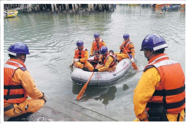
▲緊急救援中隊人員拯救受水災影響的市民