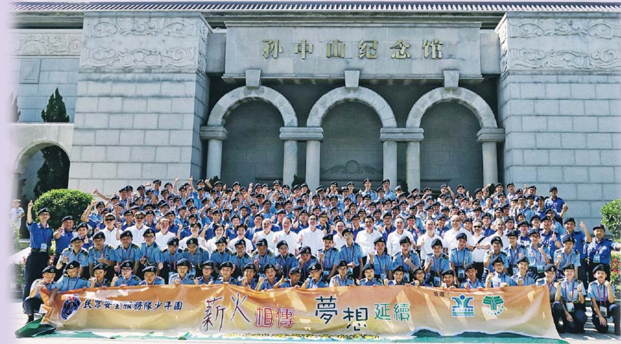
▲少年團每年到內地進行交流活動

民安隊少年團的成立目的，是鼓勵青少年透過參與有益身心的羣體活動和訓練，學習有用的技能和領導才能，藉此建立他們的自信心、責任感、自律和服務精神，從而培育他們成為未來領袖及負責任的公民。