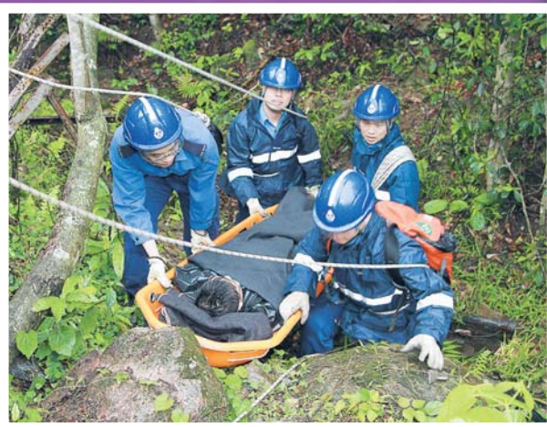
▲區域中隊人員撤離傷者