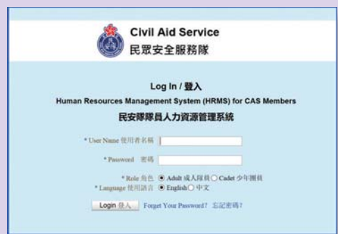
▲民安隊於2014年引入電腦化人力資源管理系統

為促進部隊人事管理的效率，民安隊於2014年引入電腦化人力資源管理系統。系統儲存了隊員的一般個人資料、曾參與的服務及訓練課程，以及出動記錄。獲授權人員可通過設於單位內的指定電腦查閱隊員的最新資料，亦可透過系統替隊員申請參加總部的訓練課程、處理隊員的調派、晉升及獎項提名，以及管理所有單位內的行動及訓練活動。新系統大大簡化人事管理的行政程序，隊員出動和訓練編排亦更靈活和更有系統。