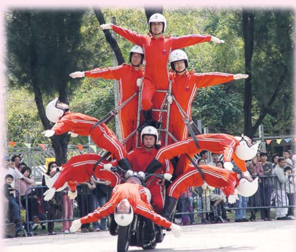
▲電單車隊表演技驚四座

為了提醒遠足人士注意安全和小心火種，民安隊每逢星期六、日及公眾假期都會派員到郊野公園遠足徑巡邏，推廣山嶺活動安全的訊息。除了日常執勤任務外，民安隊樂隊、電單車表演隊、少年團花式單車隊和少年團小鼓隊亦會參與表演活動，為市民增添歡樂。此外，民安隊隊員及少年團員亦經常參與社會服務，如長者家居清潔、捐血、賣旗和探訪老人院等。