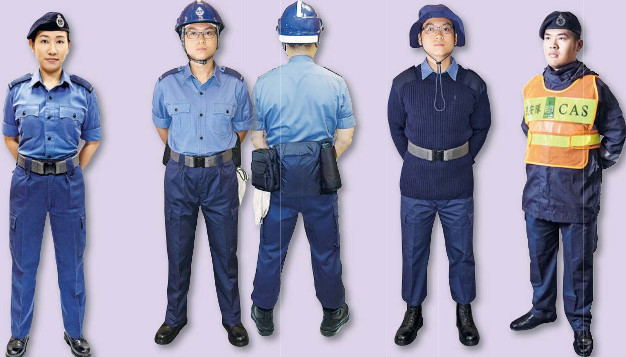
▲近年部隊更新多項制服裝備，以應付不同環境和任務需要。

民安隊自1952年成立以來，一直與時並進，不斷投入資源革新及優化部隊的器材和裝備，以提升服務質素，應付不同任務和行動的需要。過去65年間，部隊的通訊系統和隊員的制服進行了多次大更新，處方近年更引入電腦化人力資源管理系統，大大提升隊員的行動和管理效率。