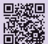
民安隊少年團入隊詳情