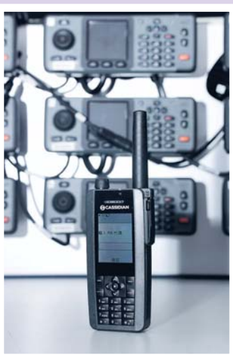
▲數碼通訊系統不但傳輸信息的容量大增，通話音質更清晰。

2014年起，民安隊採用了數碼無線系統，取代沿用多年的舊系統。數碼通訊系統不但傳輸信息的容量大增，通話音質更清晰，同時減少噪音干擾，並能加密信息，杜絕竊聽。此外，新數碼通訊系統能與其他紀律部隊及政府部門共同使用的「統一數碼通訊平台」接軌，在處理緊急災難和事故時，各救援及應急隊伍人員可迅速和有效地互相溝通及協調，從而提升行動效率。