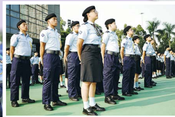
▲精神抖擻及穿着整齊制服的少年團員