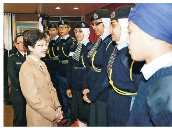
▲少年團近年吸引不少非華裔的青少年加入

南、上海、青島、四川、雲南及北京等地。少年團積極鼓勵團員參與各類社區服務，以獲得寶貴經驗，提升人際溝通技巧、擴闊視野、發揮領導才能、培養同理心和尊重別人的良好品格。此外，這些羣體活動亦可讓少年團員發揮團隊精神、加強分析和解難能力、培養自信心和獨立性，貫徹少年團「律己律人，勇於服務」的精神。