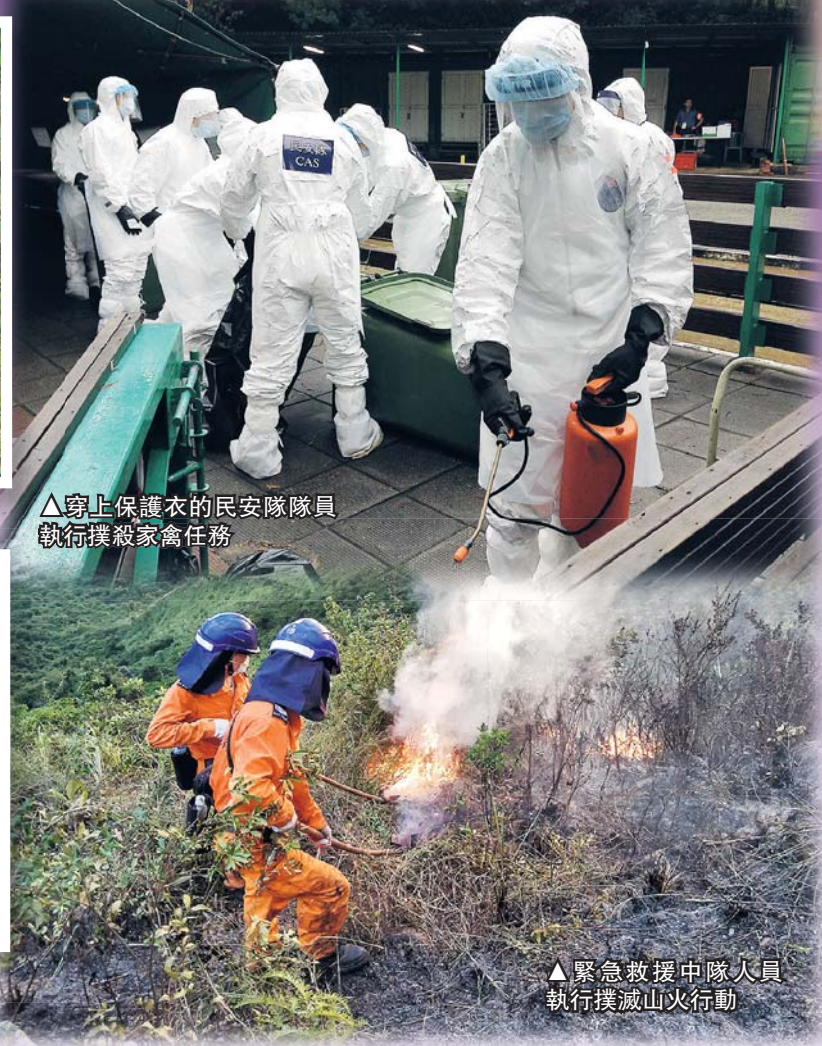
▲穿上保護衣的民安隊隊員執行撲殺家禽任務